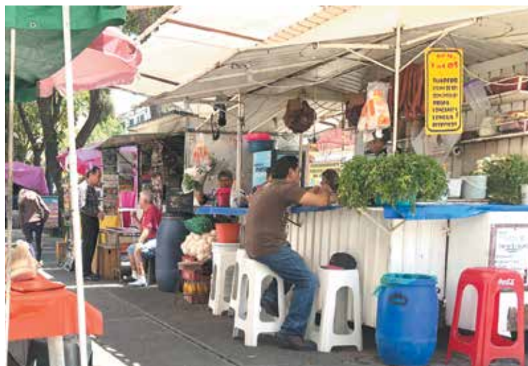
VULNERABLES. Alrededor de 31 millones de mexicanos trabajan en la informalidad.

Incluso aclara que “no es que haya indiferencia, irresponsabilidad o desafío de parte de esta población, es la necesidad que tienen de trabajar, pues nadie en su sano juicio sale a exponer su vida. Piensan que a ellos no les va a pasar