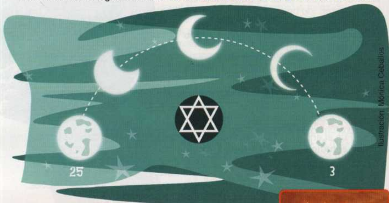
Ilustración: Mónica Ceballos

El Jánuca es una fiesta religiosa de los judíos y celebra el triunfo de lehudá "el Macabeo" sobre los sirios-griegos en el 164 a. de C. Al terminar la batalla, sólo había aceite suficiente para usar una lámpara por una noche y alumbrar el templo, pero el aceite, milagrosamente, duró ocho noches de acuerdo con la historia de esta religión. Por ello se celebra la fiesta de las luces, el Jánuca.