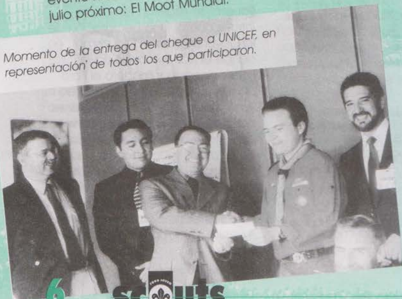
Momento de la entrega del cheque a UNICEF, en representación de todos los que participaron.