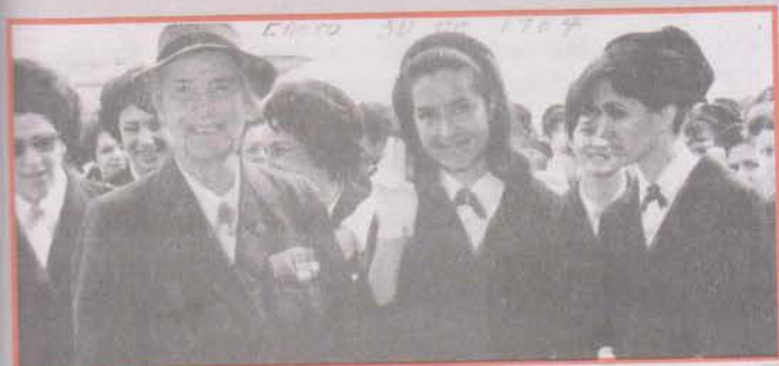
En esta fotografía aparece Lady Baden-Powell en su visita a las Guías de México en 1964, en esa ocasión estuvo en Ciudad Madero y en Tampico, Tamaulipas.